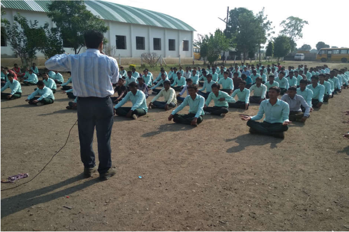
योगाचे महत्व विद्यार्थ्यांना समजून सांगताना प्रमुख योग प्रशिक्षक