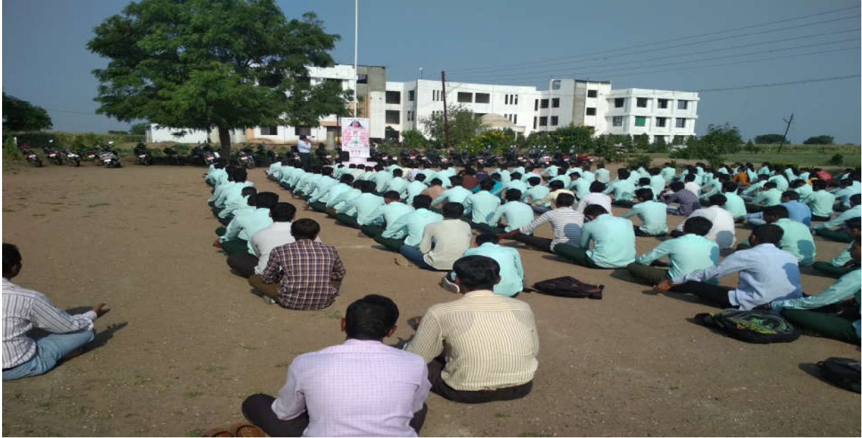
योग प्रशिक्षण महाविद्यालयातर्फे राबविताना विद्यार्थी व प्राध्यापक व प्रमुख पाहुणे