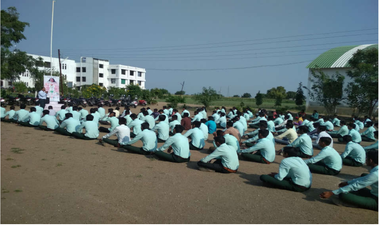
महाविद्यालयातील विद्यार्थी योग प्रशिक्षण घेतांना