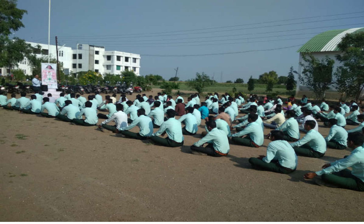
योगाचे महत्व समजून घेतांना विद्यार्थी